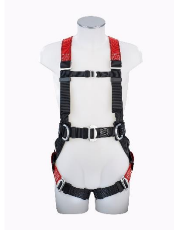
MAS 80 Vorderansicht