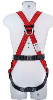
MAS 80 Rückansicht