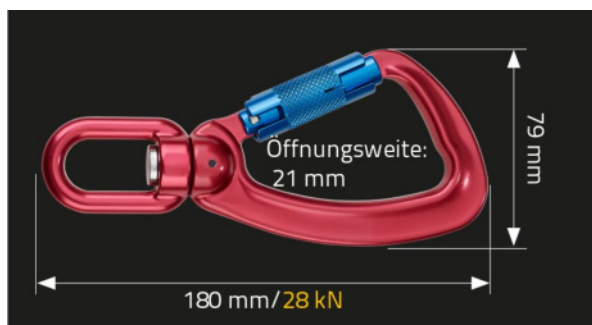
Abbildung zeigt MAS 54 illustration shows MAS 54

gepr. nach EN 362, KL. T tested according to: